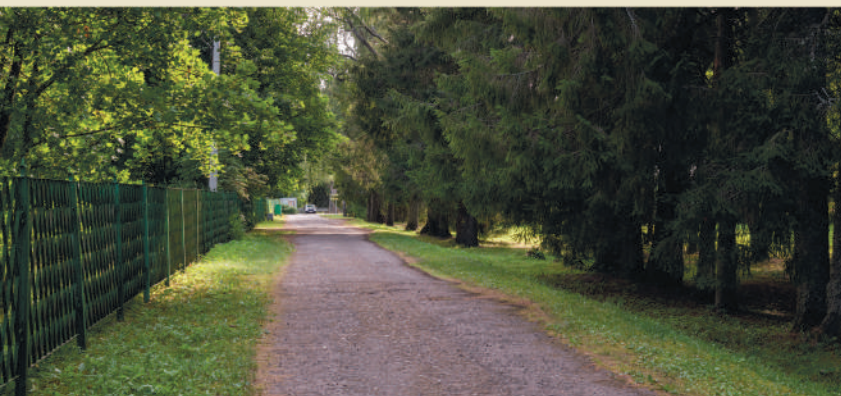
ЭКОЛОГИЧЕСКИЙ МАРШРУТ «УСАДЬБА РЕРИХОВ»

В начале XX в. в здешних местах располагалось молочное хозяйство с великолепными помещениями для рогатого скота. Выделялось масло, которое отвозили в Санкт-Петербург. Были большие конюшни, отличные рабочие лошади, исчислявшиеся десятками, и великолепная барская конюшня. Здание конюшни сохранилось до наших дней.